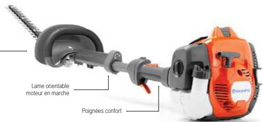
Lame orientable moteur en marche