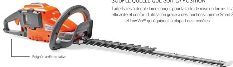
Poignée arrière rotative